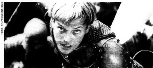
Jeanne d'Arc au bûcher är politik, poesi och musik i en – tro det eller ej – skön förening.

Jeanne d'Arc au bûcher är inte bara en värdig konstnärlig företärd för den modernistiska mellankrigstiden. Genom sin slagkraftiga men aldrig gottköpsenkla text-