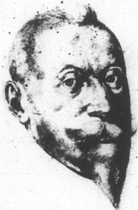
Man med makt. Gustav II Adolf hade mer makt än adeln först trodde och lät sig inte styras.