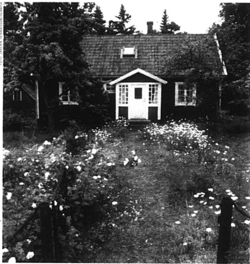
Sommaridyll i Falu rödfärg. Carl Hårleman anpassade på 1700-talet den franska arkitekturstilen på modet till svensk verklighet. Hans tankar lever ännu kvar.

En av Carl Hårlemans bästa vänner var Carl von Linné som dock likt andra nära, fick kamma på hans skiftande lynne. Sålunda