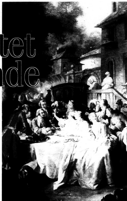
Europas kultur var givetvis det mönster som alla andra kulturer under 1700- talet jämfördes med. Målning av Carle van Loo: "Måttid på landet" 1737, utförd för Ludvig XV:s lilla matsal på Fontainebleau.

Frängsmyr utgår bland annat från det stora antal dissertationer som på 1700-talet skrevs vid