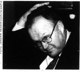
Under Förintelsekonferensen installerades Göran Persson den 27 januari som en officiell minnesdag för Förintelsen. Minnet av det hemiska blir en religion.