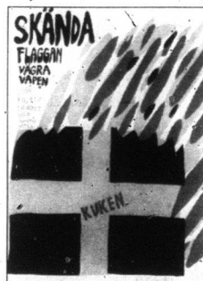
Accepterad. Carl-Johan De Geers Skända flaggan hänger prudentligt inramad i Moderna museets Eftermajrevolten-utställning.