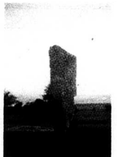
Östen Kjellman använder sig av många fornnordiska källor i sin bok. Här ses kungsstenen.

I början av 800-talet angreps Irland av vikingafloetter på 120 skepp, och ånyo var det klostret och kyrkorna som förstördes, motorn bakom den kristna offensiven. År 845 intogs och plundrades såväl Paris som Hamburg. Ansgar flydde med relikerna. År 852 upprättade Olav Hvitte kungariket Dublin som ägde bestånd till 1171. År 871 intogs London och Danelagen inrättades, det danska nordöstra England. Omkring 900 tog Rollo över Normandie, varifrån så småningom England övergavs 1066.