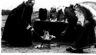
"Konflikten mellan romare och germaner bottnade i en kulturskillnad, kejsarlig hierarki kontra demokratisk bondekultur."

Med Karl den store inleddes på allvar kristnandet av Nordeuropa. Schwaberna och friserna kuvades, och som sagt sachsarna. Metoden var enahanda, de besegrade fick välja mellan döden och dopet. Revanschen för massakern på sachsarna ägde rum vid floden Aller, med ett första angrepp 787. Fyra fartyg från Hordaland i Norge gjorde sedan strandhugg i Northumberland. 793 angreps Lindisfarne: "Då de främmande skeppen nådde kusten, hoppade besätt-