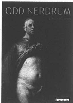
Qjld Nerdrum. Utställningsaffisch Kulturhuset 2000