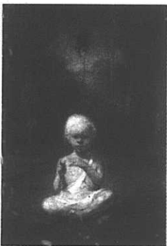
Självpporträtt som baby, 2000. Privat ägare.