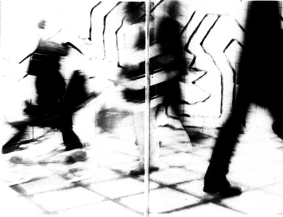
Snabbfilen genom livet. Gasen i botten. Sverige har blivit landet där allt går

fort - vi pratar fort, dricker fort och orkar aldrig vänta på något.