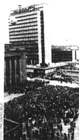
Framtidvisioner. Invigningen av Hötorgs-city 1959.

"Kanske är Sverige fortfarande Europas sjuka man, svårt pågått av suedoclerosis"