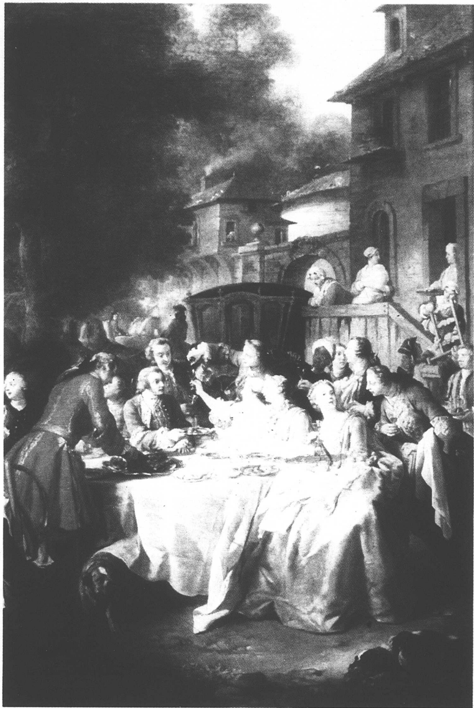
Hur man äter en enkel middag under bar himmel på landet med stil.

"Bara en barbar tror att det är fritt fram att ta för sig bland alla topplösa skönheter på stranden utanför St Tropez"