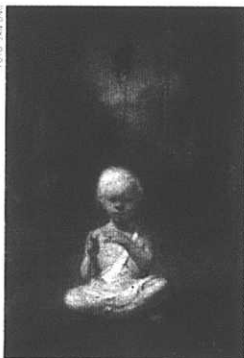
Självporträtt som baby, 2000. Privat ägare.