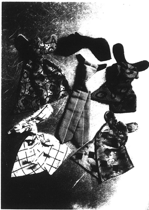
Kravatten var oundgänglig för författaren och dandyen Charles Baudelaire.

I detta nya Paris kände sig Baudelaire inte helt hemma, men ändå hörde han kanske till det i en grad som han inte själv insåg. Modet, det nya urbana livet och det konstnärliga avantgardet var intimt sammankop-