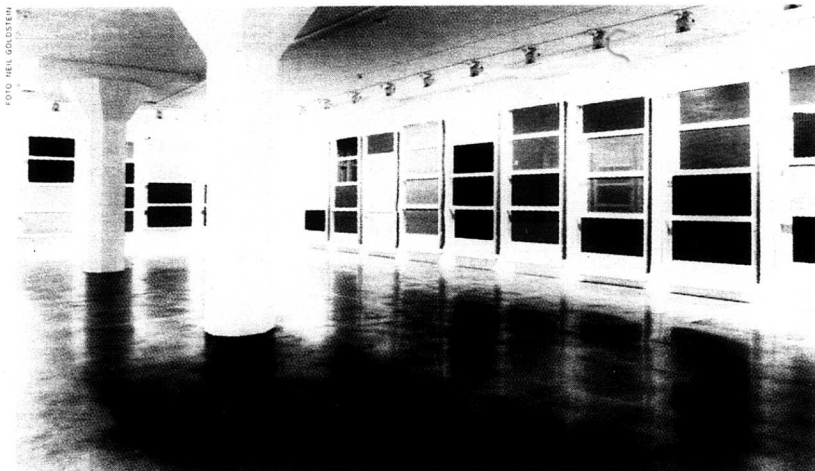
Bortom museerna kan man hitta lite nytänkande. Magasin 3 vågar till exempel satsa på Pedro Cabrita Reis ...