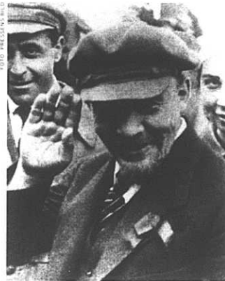
Lenin – med politiskt korrekt keps.

Den unga borgarklassen hade en gång valt fracken som jämlikhetsattribut, men uniformer och all sådan mundering som betecknade rang och grad. Fracken var akademiernas