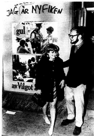
Att Lena Nyman var central i Nyfikensfilmer gjorde inte publiken mindre chockerad.