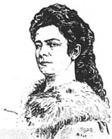
Kejsarinnan af Österrike mördad.

Hon älskade vilda hästritter, stormiga sjöfärder och ansträngande bergs- och skogsvandringar. Hon lät sätta upp ribbstol och romerska ringar i Wiens Hofburg