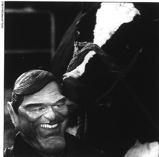
En mask att älska.

SÅ BYGGDES kejsarhusets image upp. En propagandakampanj av exempelvis effektivitet: det romerska imperiet var det mest väloljade företag världen någonsin skadat. Vi använder fortfarande dess logotyper, termer, institutioner och tänkesätt. Horatius sade att han med sina dikter uppfört ett monument varaktigare än brons, och han hade bevisligen rätt.