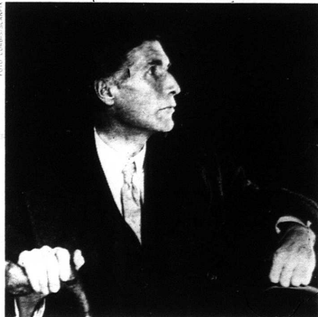
John Cowper Powys är en av de viktiga tänkare som helt saknas i Penguins nya filosofiflexikon.

"Man måste tyvärr säga att preventiv diplomati har spelat en undanskymd roll på Balkan under 1990-talet."