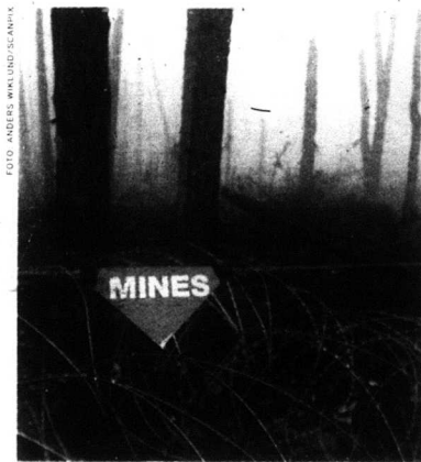
Många har dött på Kosovos minfält.

"Man måste tyvärr säga att preventiv diplomati har spelat en undanskymd roll på Balkan under 1990-talet."