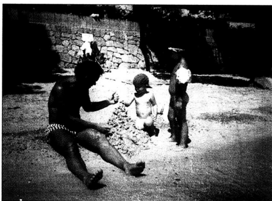
Antiparos en av de grekiska öar som lämpar sig bra för båtluvfande barnfamiljer.

Rumsutryrarna finns redan på plats på de stora båtarna, men vänta med att bestämma var ni ska bo tills ni kommer i land. Uthyrarna på