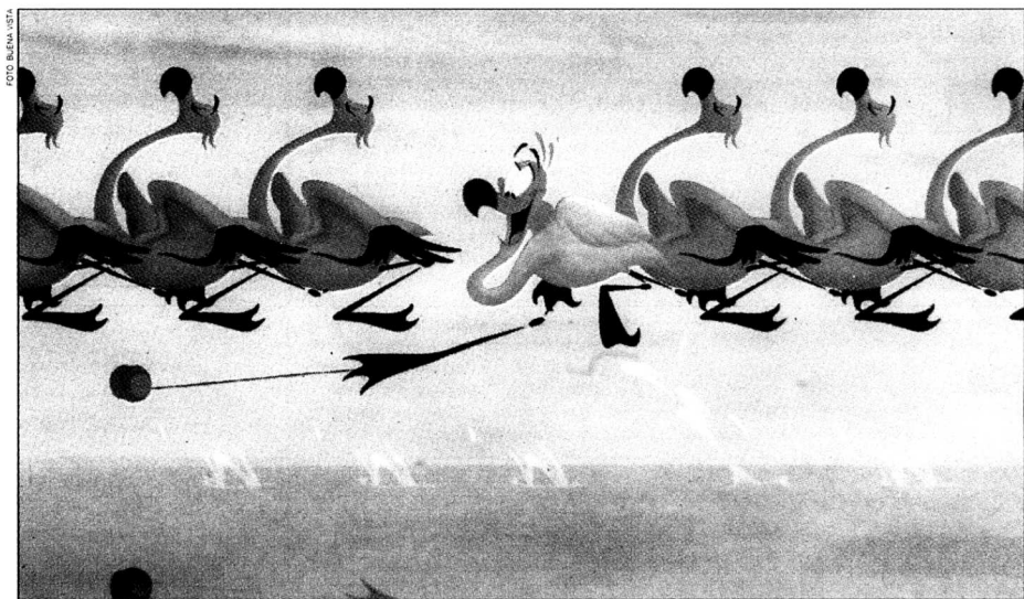
Tarzans karaktär (övre bilden) är inte lika verklig som människorna omkring oss hur mycket skateboard han än åker på lianerna och därför rekommenderas Disneys tidigare filmer. Undre bilden från nyinspelningen av Fantasia.

försämring som i regel vidlåder Disneybolagets filmprodukter från 1970-talet och framåt. Med dataanimationens genombrott försvann emellertid den sista rest av genuint hantverk som präglade filmerna under Walts livstid.