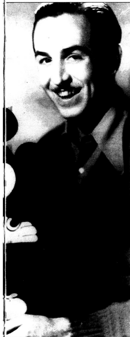
Smakat kreativt geni med respekt för åskådaren.