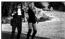
"Austin Powers - The Spy Who Shagged Me"