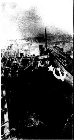
Röda arméns hämnd för nazisternas övergripande blev katastrofal.

Antalet våldtäkter röda armén begick är fortfarande, även om individuellt lidande är omätbart, och torde vara utan motsvarighet. I en vetenskaplig studie från 1992 uppskattas 1,9 miljoner tyska kvinnor ha våldtagits och ofta uppreppade gånger. Härtill kom mord, plundring, förstörelse och deportering till Sibirien. Barbariet var av sådan