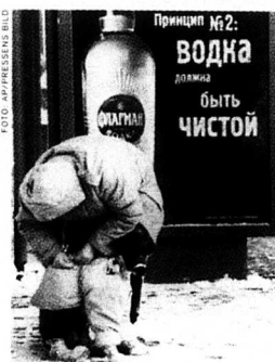
Kallt, kallare, kallast – Ryssland i ett nötskal.

– Vi äger 7 procent av världens oljetillgångar, säger Parsjev i inter-