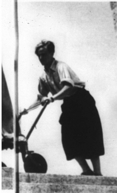
denna dansös, skådespelerska, regissör, doku-

svarar filmaren utan att tveka: när hon anklagades för att ha använt zigenare ur ett koncentrationsläger i en av sina filmer. För det första var de med frivilligt, för det andra var det inget koncentrationsläger utan ett läger där de bodde frivilligt. En del av dem hade hon blivit kamrat med och har kvar tackbrev från dem.