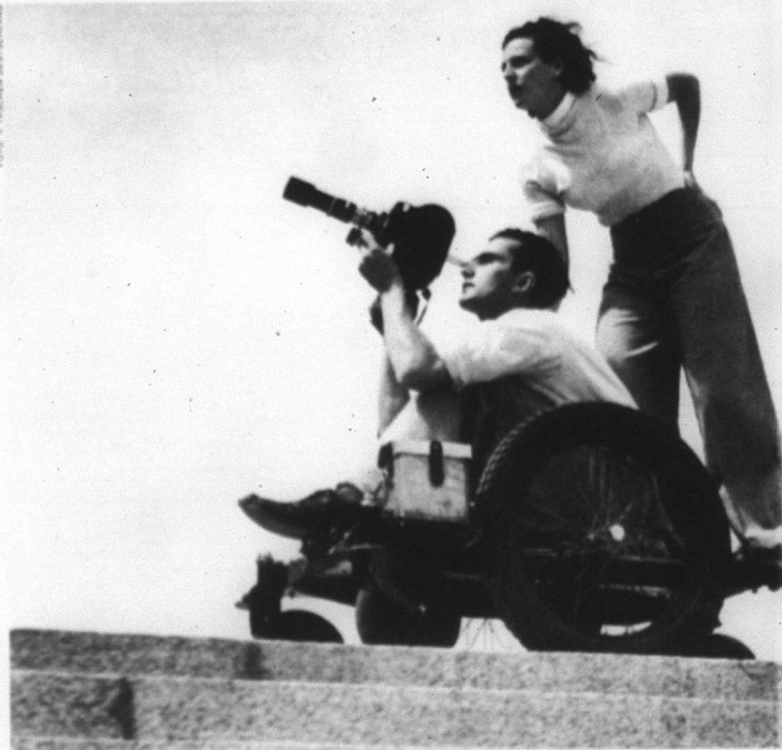
Den goda relationen med Hitler har länge legat Leni Riefenstahl i fatet. Nu står det i alla fall klart att mentalfilmare och djuphavs fotograf har lämnat betydande spår i världen.