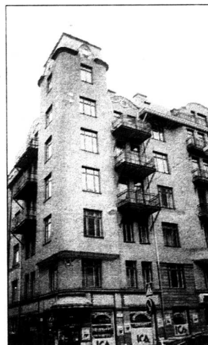
Strindbergstornet. På Drottninggatan 85 hyllades Strindberg av Stockholms arbetarekommun på sin sista födelsedag den 22 januari 1912.