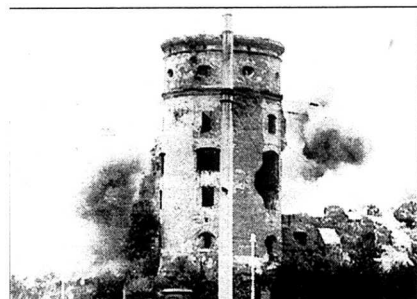
En stadssymbol i graven. Königsbergslottet utsattes för aggressiva brittiska flyngangrepp under andra världskriget. Här sprängs resterna av byggnaden.