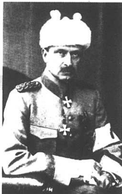
Som Finlands överbefälhavare under tre krig var han ingen krigshetsare. Han var bland annat mot-

Trots en framstående militär karriär, bland annat som Finlands överbefälhavare i tre krig, så var krigslyskan som regel med Mannerheims färd. Han hade, med undantag för det inbördeskriget som gav Finland självständighet, för vana att tillhöra den förlorande