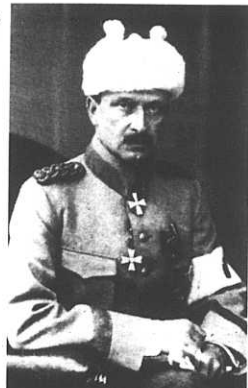
Det är i dag 50 år sedan Gustaf Mannerheim avled. Ståndare till vinterkriget och fortsättningskriget.

"Han ville inte gå till historien som 'bödeln av Finland'"