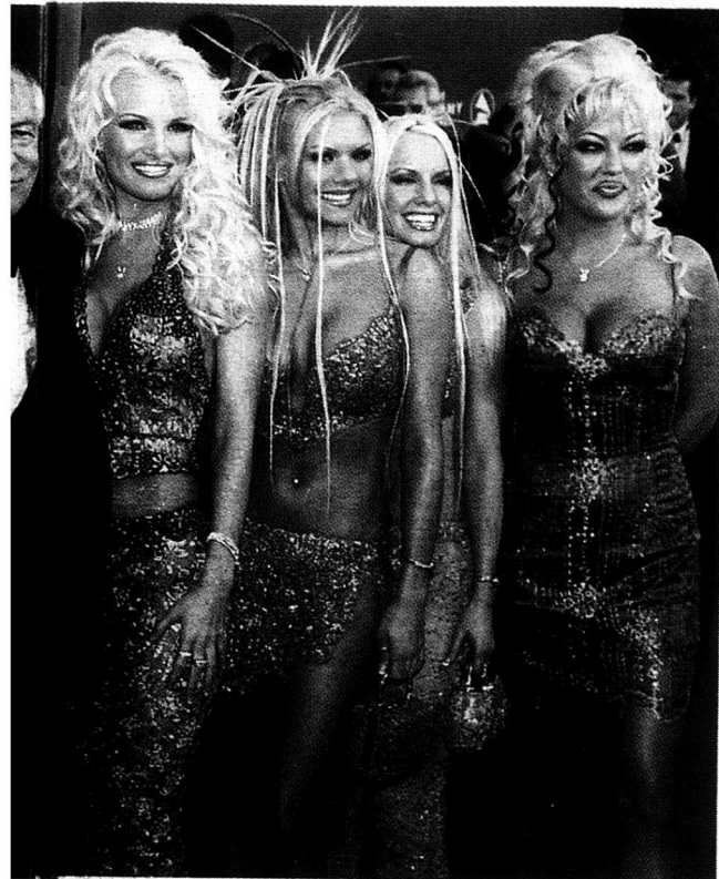
Här är han på väg till grammyutdelning i Los Angeles omgiven av några av sina flickor.

vid namn Gloria Steinem, fuskade sig till ett jobb som bunny. Sedan sade hon upp sig efter avslutat undercoveruppdrag och skrev en ilsken rapport om hur det gick till hos Playboy. Hon blev USA:s mest kända feminist.