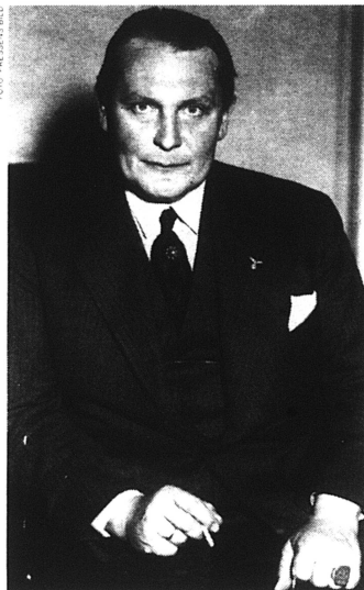
Göring, Himmler och Ribbentrop var alla nyckelpersoner för naziregimens relationer till Sverige.