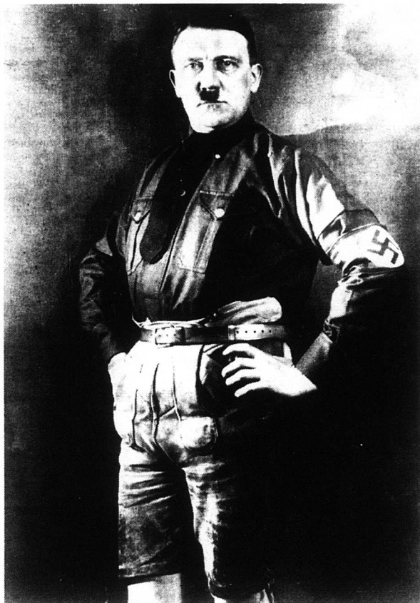
Adolf Hitler förförde det tyska folket.

dra sig undan en hel vecka för att Hitler skulle "komma i rätt stämning".