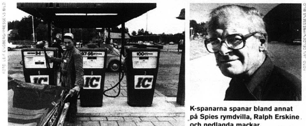
K-spanarna spanar bland annat på Spies rymdvilla, Ralph Erskine och nedlagda mackar.