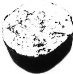
En ost är en ost är en ost.

ande fransk brie, gjord på opastöriserad mjölk, och lägg den bredvid en dansk ost med samma namn från tillverkaren Høng. Jämför dem utan förutfattade meningar.