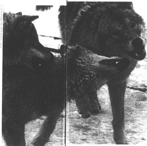
För nazisterna stod vargen för lojalitet.

"Skiljevägarna gick inte mellan människor och djur utan mellan segrare och besegrade"