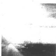
Hyllning till Springsteen.

F Y N D E T Bruce Springsteens skiva Nebraska från 1982 spelades in på en fyrkanlig bandspelar i artistens sovrum. Wolf Biermann gjorde sin första skiva, Chausseestrasse 131 , på samma sätt redan 1968, men medan han hade politiska skäl var det estetiska övergången som föranledde Springsteen att hålla sig borta från skivstudion. Resultatet blev det avskalade och intima sound som har gjort Nebraska till en klassiker.