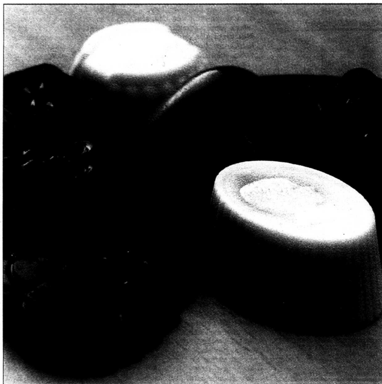
Guldkorn. Den belgiska chokladen är världens bästa, om man får tro belgarna själva. I vilket fall som helst har den gott rykte.