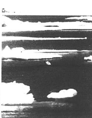
Myter frodas, integreras och cementeras i vår världs bild. Snö är bara snö även på Grönland och kvinnlig omskärelse är ingen muslimsk sedvänja.

ka bild diskuteras än i dag på fullt allvar. Trots att Freemans bok Margaret Mead and the heretics: The making and unmaking of an anthropological myth (1996) grundligt gör upp med hennes fantasi.