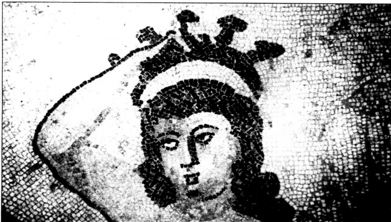
Romarna var galna i mosaik och den antika mosaikläggningen anses ha fulländats i den romerska konsten.

Fram trädde så småningom motiv på, förutom bikinibrudar och jakter, även Herkules stordåd, olika cirkusnummer, fantasidjur och riktiga djur, vindruvskördning. Bilderna dokumenterar inte bara dätidens