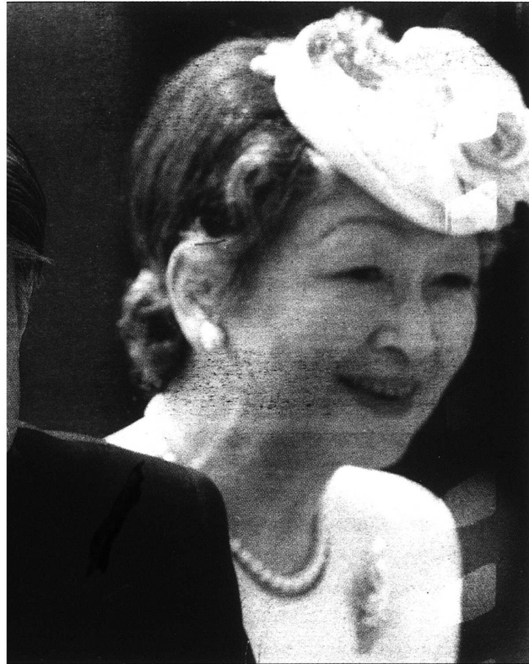
svets motstånd. Men även om kejsarparet har moderniserat hovlivet står kejsarhuset inte särskilt högt i kurs

berna mot Nagasaki höll han sitt besynnerliga radioanförande på hovjapanska, där han konstaterade att "krigsläget inte nödvändigtvis utvecklat till Japans fördel".