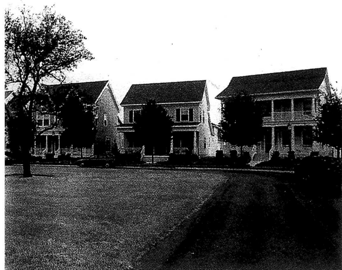
ddad från övriga USA:s klasskillnader och fattigdom. Här är allt lyckligt och välordnat. Eller?

Arkitekturen är gammaldags, men inne i husen är det framtiden som gäller: alla husen i Celebration är anslutna till ett nätverk. Skolan skulle från början inte ens få heta skola – di lärde hävdar att ordet "learning center" stimulerar barn – "learners" – att lära sig mer. Celebration och pedagogikteamet under ledning av Harvardprofessorn Howard Gardner fick senare ge sig på denna punkt. Betyg finns i alla fall inte. Till en början hade Disney även ambitiöst tänkt göra vuxenbildningen till stadens centrala punkt. Disney Institute skulle den heta och den skulle vara ett amerikanskt Folksket hus.