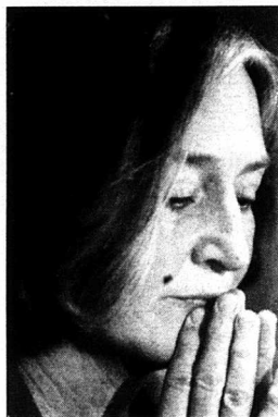
En rar och en vanlig.

Men finansministern har iakttagit decorum. Han har aldrig dramatiserat eller öppnat tithål i fasaden. Minns hur han på press-