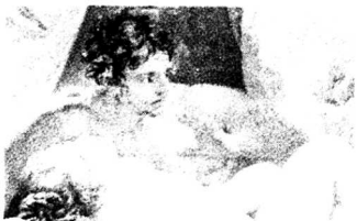
I sinnlig 1700-talsmiljö, som i en tavla av Boucher, drivs huvudpersonen till att döda för doften av unga flickor.

Grenouille växer upp till en liten, krokig och haltande gnomtyp, så obedyglig att just ingen lägger märke till honom. Det doftlösa i hans apparition gör honom närmast genomskinlig. Bakom hans obedydliga yttre bultar hatet men också passionen. Lukter blir hans