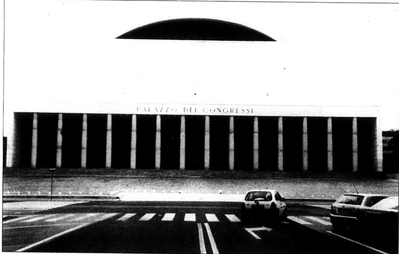
Palazzo del Congressi anses vara ett typexempel på fascistisk arkitektur. Förhallen har faktiskt jämförts med Asplunds förhall på Skogskyrkogården i Stockholm.