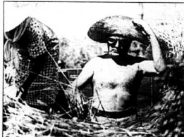
Benito Mussolini, Italiens diktator 1924–1943.

Med ryggen mot kongresspalatset ses i andra änden av lika spikraka Viale della Civiltà Lavoro. EUR:s mest kända och välfotografierade fastighet, Palazzo della Civiltà del Lavoro. De 216 etruskisk-romerska valvbågarna i ytterväggarna känns igen från bildböckerna. Just den här dagen pågår kon-