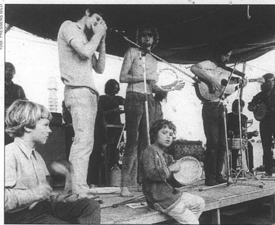
Ninaninananina. Förut sjöngs det på Gärdet. Nu sjöngs det på Götgatan.