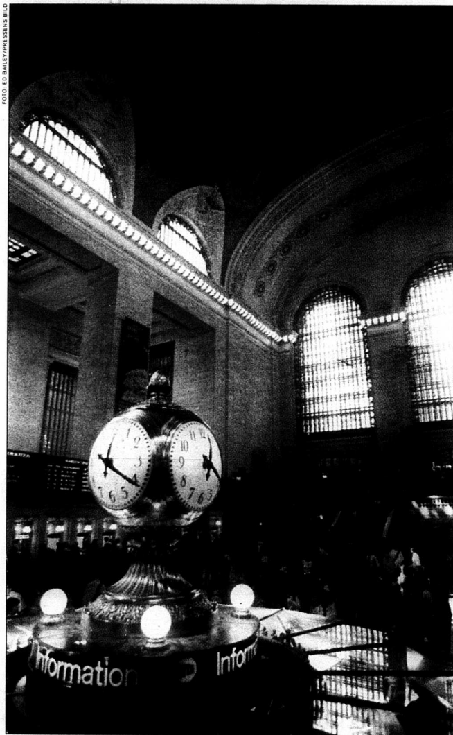
Trots att Grand Central Terminal fyllde ansevliga 85 år den 2 februari är såväl den ljusa marmor- och granitklädda fasaden som interiören i gott skick. "Nya" Grand Central har renoverats och återställt i originalskick för 200 miljoner dollar, det vill säga 1,6 miljarder svenska kronor.

– I dag kan alla som vill åka tunnelbana och buss utan att känna obehag. När jag har vänner och