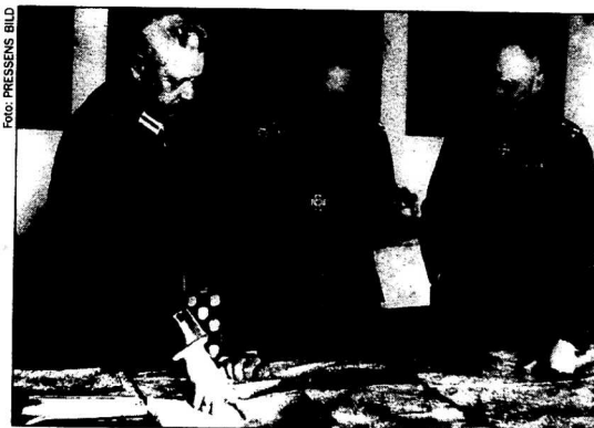
Krigsherrarna. Paul von Hindenburg, generalstabschef efter 1916, förklarar frontförloppet för kejsar Wilhelm II medan generalkvartermästare Erich Ludendorff ser på.

John Keegan The First World War Hutchinson, 1998