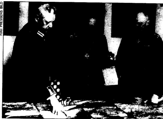
Krigsherrarna. Paul von Hindenburg, generalstabschef efter 1916, förklarar frontförloppet för kejsar Wilhelm II medan generalkvartermästare Erich Ludendorff ser på.

Det ledde i sin tur till slaget vid Marne, där den tyska framryckningen stoppades och Paris räddades.