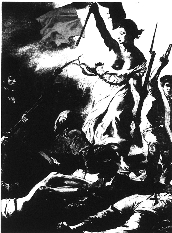
Efter Encyklopedin kom den franska revolutionen, men enligt artikel författaren är det lika värslöst att påstå att Diderots och Voltaires böcker orsakade omvälvningen som att hävda att Marx och Engels orsakade den ryska revolutionen. Målningen "Friheten på barrikaderna" av Eugène Delacroix 1830.

SPECIELT DIDEROT bryter med denna tradition. Encyklopedin är intresserad av hur man gör saker, av hantverkarnas och byggarnas ordlösa kunskap. Spanare, ja man kunde nästan säga spioner, skickas ut i Paris vidsträckt industriella liv. För att se hur båtar byggs, hur gobelänger vävs, hur gjutfornarna till skulpturerna formas.