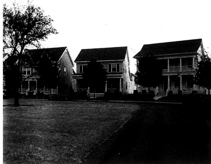
ddad från övriga USA:s klasskillnader och fattigdom. Här är allt lyckligt och välordnat. Eller?

Arkitekturen är gammaldags, men inne i husen är det framtiden som gäller: alla husen i Celebration är anslutna till ett nätverk. Skolan skulle från början inte ens få heta skola – di lärde hävdar att ordet "learning center" stimulerar barn – "learners" – att lära sig mer. Celebration och pedagogikteamet under ledning av Harvardprofessorn Howard Gardner fick senare ge sig på denna punkt. Betyg finns i alla fall inte. Till en början hade Disney även ambitiöst tänkt göra vuxenbildningen till stadens centrala punkt. Disney Institute skulle den heta och den skulle vara ett amerikanskt Folkskaps hus. Fyra år visare kan man konstatera att