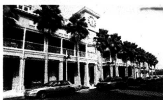
Gamle Walt Disneys dröm om en futuristisk stad har förverkligats. Floridas Celebration är en idyllisk stad.