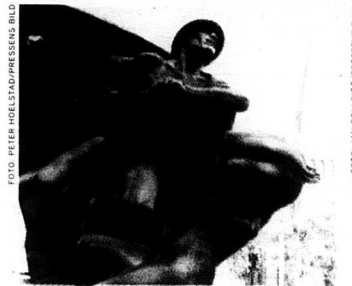
Makt, våld och blod är viktigare än pengar.

Ferguson hävdar att moderna regeringar har lärt sig någonting av historien, genom införandet av moms. Momsen har blivit en ny och lukrativ form av indirekta skatter som ger stora inkomster. Han förvänar sig också över att inte fler reagerar mot de höga momsstaterna.