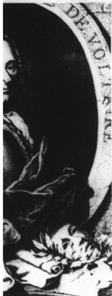
bilden av Voltaire.

har tagit till. Han ger en levande och engagerande bild av en av Västerlandets stora filosofer, samtidigt som han för det heliga kriget vidare. Därför förtjänar hans bok att läsas.